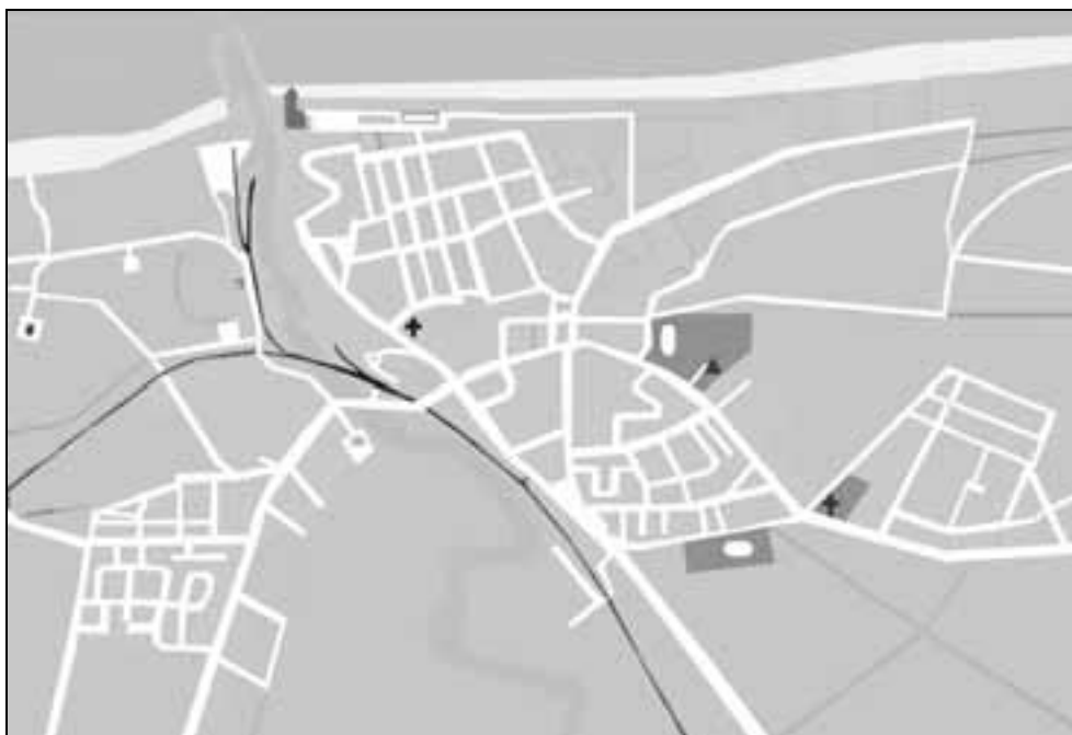
2. Plan Ustki.