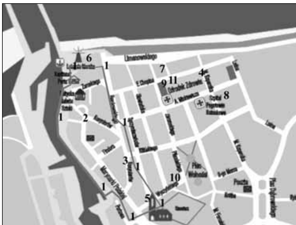
3. Plan Ustki z zaznaczeniem obiektów zabytkowych.