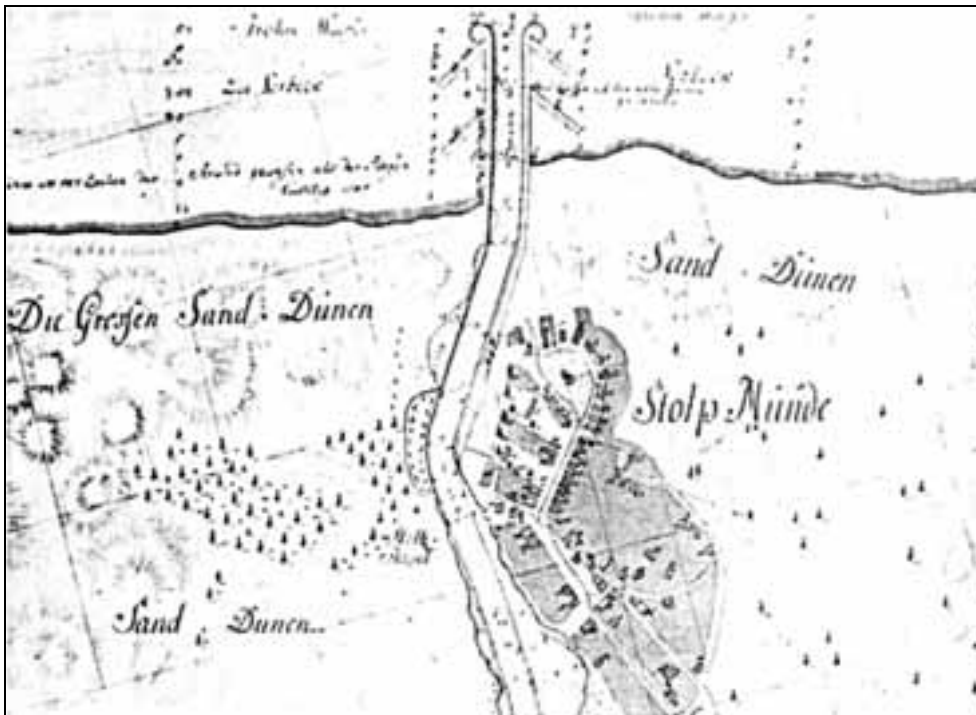
4. Mapa Ustki z 1709 roku.